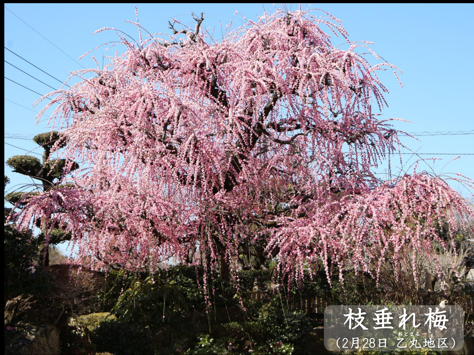
枝垂れ梅 おとまる (2月28日 乙丸地区)