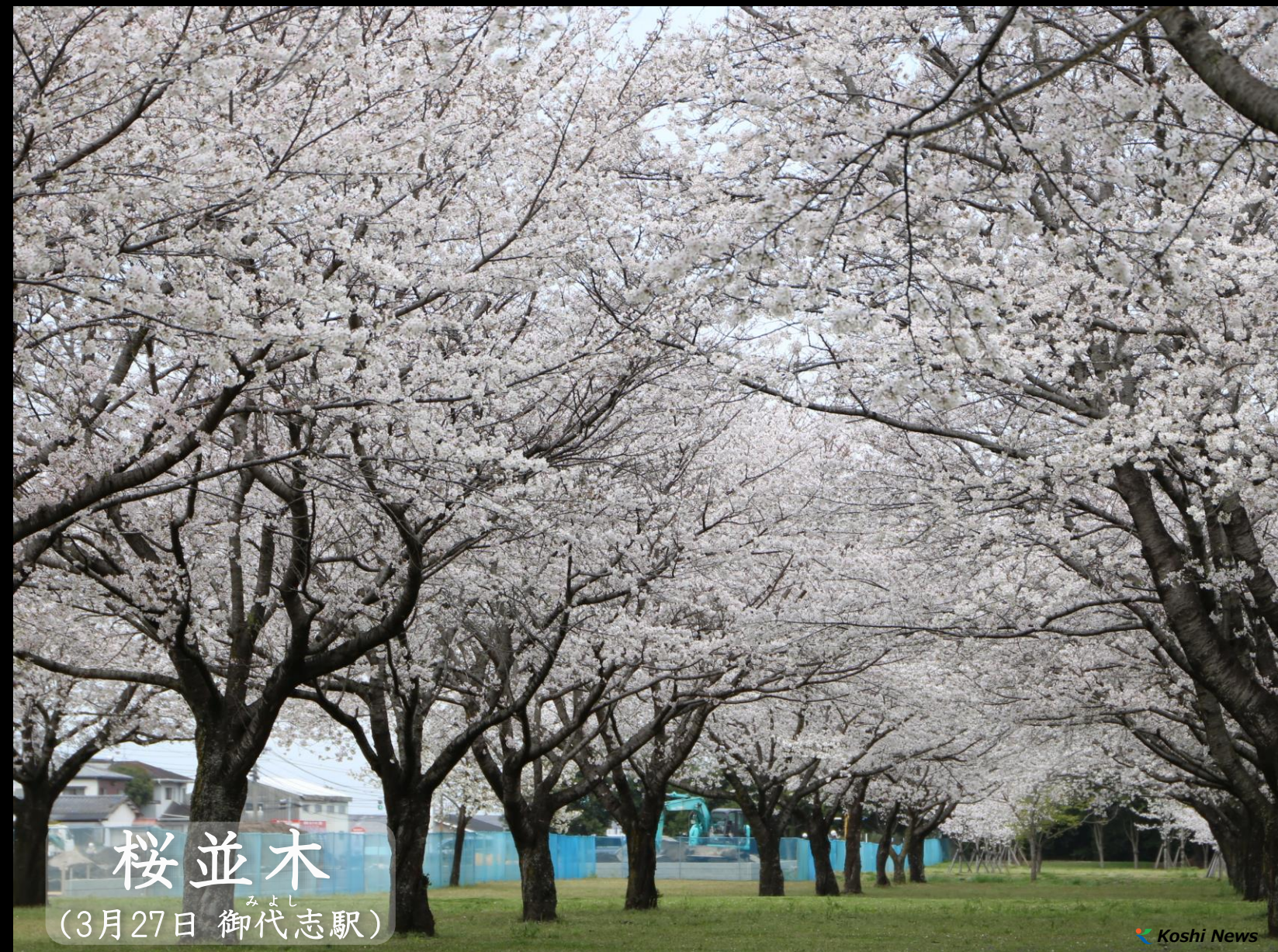
桜並木 みよし (3月27日 御代志駅)