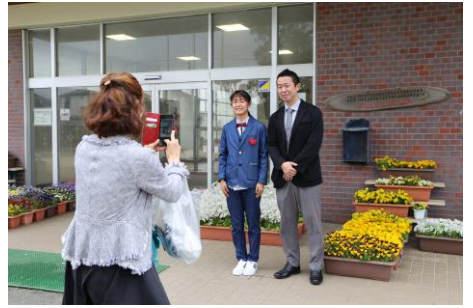
3月23日 合志南小学校