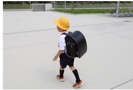
4月11日 合志楓の森小学校