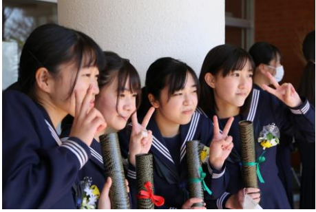
3月3日 西合志南中学校