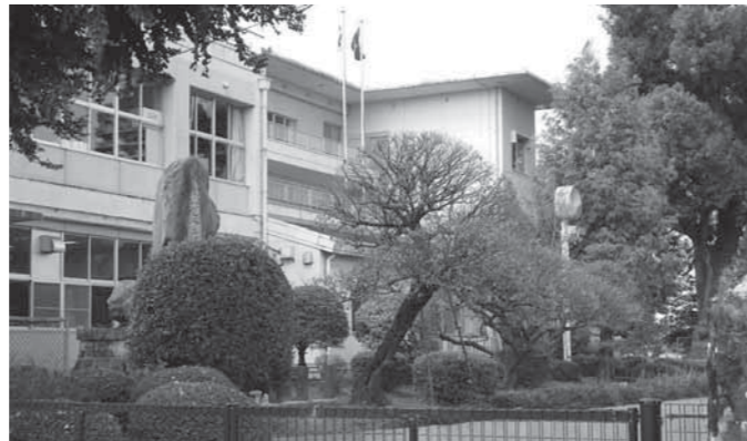
西合志第1小学校風景

合志市はエコ対策に力を入れており、議会で要望していました。今回、太陽光発電を全小中学校に設置しました。