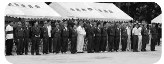
上庄区ホタル祭り

6月10日(日)午前8時30分から合志市中央運動公園グラウンドで消防小型ポンプ操法大会が行なわれました。