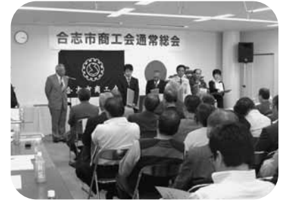
合志市商工会総会