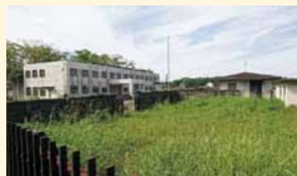
建設予定地 (医療刑務所跡地)