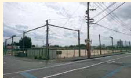
建設予定地 (みずき台グラウンド)

黒石地区防災拠点センター 建設工事 4億2,460万円 小中学校新設校建設事業 設計委託 2億3,328万円 西合志庁舎周辺市道工事 2,800万円