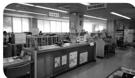
西合志総合窓口課

答 平成30年度と平成29年度の5、6、7月の取り扱い件数を比較すると3カ月で総件数1288件、月平均429件増加である。庁舎集約後、戸籍の証明関係は減っているが健康福祉部が移転したことによりこの関連業務が3カ月で3334件増加している。