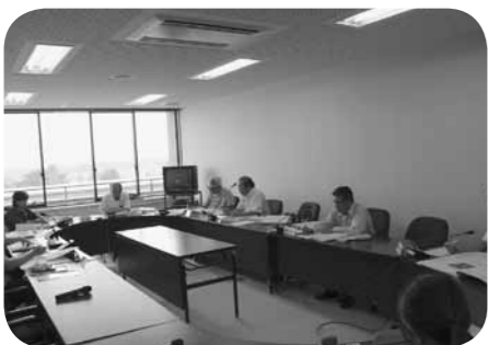
9月定例会委員会審査

問 電気料金について九州電力の割引の制度は把握されているか。 答 電気料金については自由化になっており、今後検討し必要な場合は見直しをしていく。 問 熊本北合志地区防犯協会連合会が4月発足したが、合志市と熊本市の委員数と負担割合について伺う。 答 防犯協会は28名で構成されており、合志市からは防犯団体等の長7名が委員となっている。負担割合については、人件費は固定