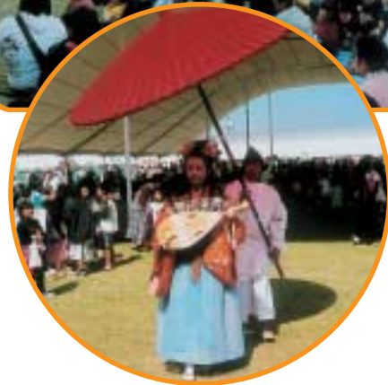
西合志町 よかとこ 弁天祭

第11回協議会、第12回協議会、第13回協議会が開催されました。 第11回協議会では特別職の報酬等についての報告がありました。 第12回協議会では新市の市章について小委員会からの報告がありました。 第13回協議会では新市の市章が決定されました。