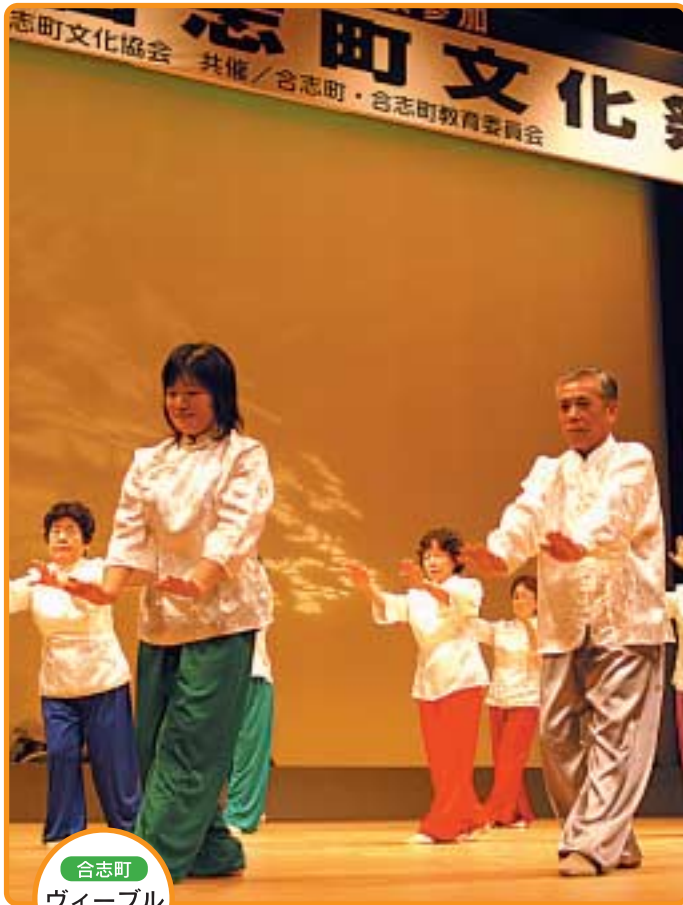
合志町 ヴィーブル フェスタ

○発行責任者／合志西合志二町合併協議会 会長 秋吉不二雄 ○編集／合志西合志二町合併協議会事務局 菊池郡合志町幾久富1909 - 110