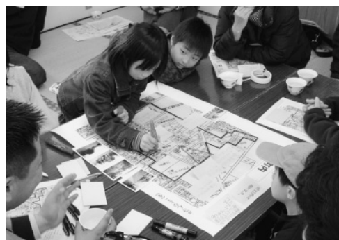
「ここが危険よねえ」