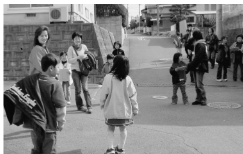
歩いて危険箇所チェック