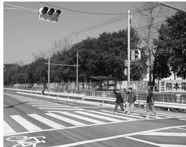
交通マナーを守って、「無事故・無違反」

3月17日、国道387号線熊本電波工業高等専門学校前交差点に押しボタン信号機が設置され点灯式が行われました。 当交差点は歩行者の横断が多く、朝夕の自動車の往来も激しい場所です。このため、県公安委員会が信号機を設置しました。