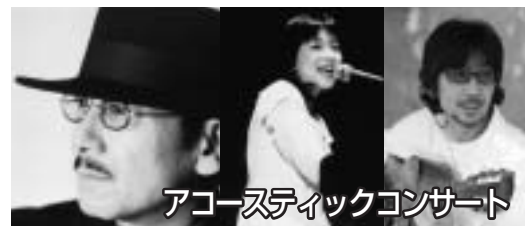
アコースティックコンサート