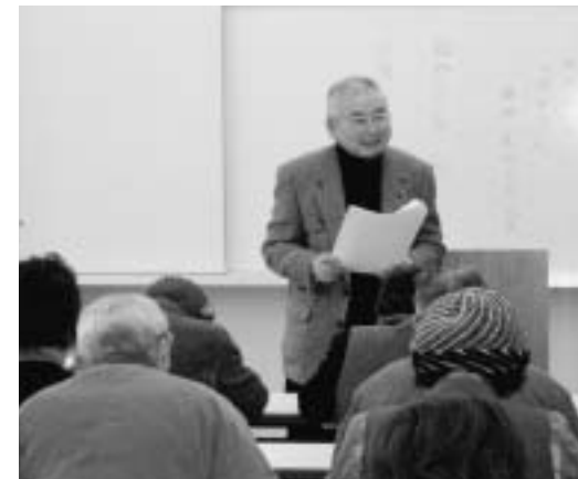
星永先生のお話しは感動モノ

定評ある星永先生の話を楽しみに、毎回参加する受講者も多く、この日も29人の参加者が感動の時間を過ごしました。