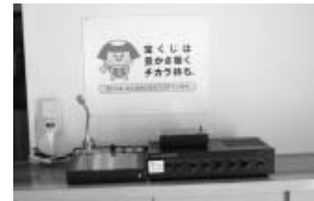
整備されたワイレス放送システム

このコミュニティ助成事業は、宝くじ普及広報事業費を財源として財団法人自治総合センターが助成を行うもので、今後の城区・上生区の活性化が期待されます。