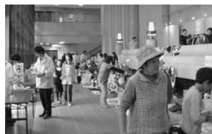
ホールでのフリーマーケット