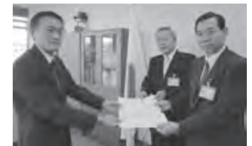
村田副知事(写真上、左)と金高警務部長(写真下、左)に要望書を提出