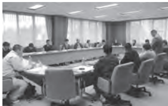
さまざまな意見が交わされた協議会

第2回の協議会では、事務局から合志市での具体的な取り組み案を提示して、活発なご意見をいただきました。その中で、大まかな取組方針としてレジ袋削減に向けて事業者・協議会・合志市で協定を結ぶこととしました。また、取組方法についてはレジ袋の無料配布中止を基本とする取組みと、無料配布中止以外の取組みを行なう2方式で行なうことなどを協議しました。