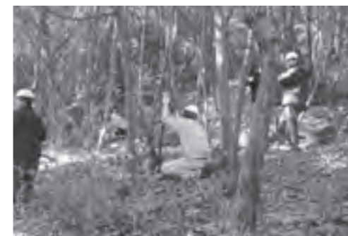
作業に精を出す参加者