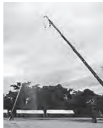
夏季訓練での玉落とし競技

また、平常時においても訓練のほか、応急手当の普及指導、住宅への防火指導、特別警戒、広報活動などに従事し、地域における消防力・防災力の向上において重要な役割を担っています。