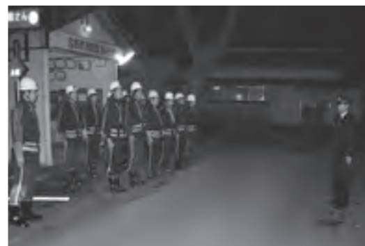
年末警戒巡視で市長が激励 安心して新年を迎えることができます