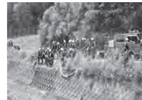
春季訓練での中継送水訓練(火点まで遠い位置からポンプをつないで水圧を落とさないようにする訓練)