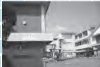
正門から見た校舎

教育目標 人間尊重の精神を基底におき、志を合わせ、すべての教育活動を通して豊かに生きていく力を育成する