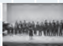
ヴィーブルでの合唱コンクール