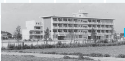
昭和55年開校当時の校舎(生徒数360人)

これに加えて、校是が設定されています。自他尊重・思いやりの「支えあい」、協力・協調・責任の「扶けあい」、切磋琢磨・根性の「高めあい」の3つです。