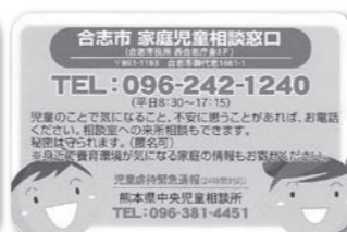
家庭児童相談窓口