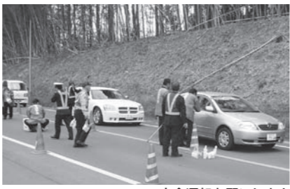
▲安全運転をお願いします

秋の全国交通安全運動が実施されるのに伴い9月17日、県道熊本住吉線でシートベルト・チャイルドシート着用推進タッチ