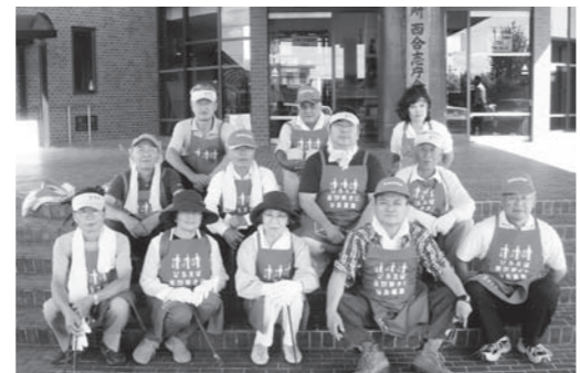
▲菊池たばこ販売協同組合の皆さん

当日は西合志庁舎周辺の県道や市道沿い、ユーパレス弁天周辺などでたばこの吸い殻や空き缶を拾いました。