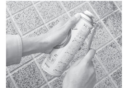
火気に注意し、缶に穴を開けて出しましょう。

プラスチック製ライターはガスを使い切った後、生ごみと一緒に出して下さい。また、石油ストーブは燃料と電池を抜いて出してください。