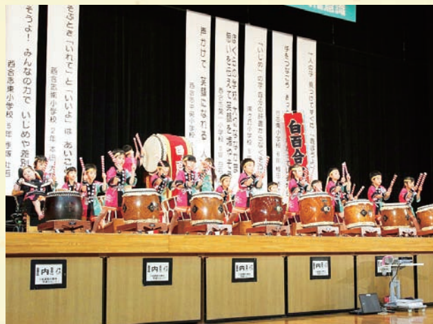
▲迫力ある白百合太鼓の演奏

第6回合志市人権フェスティバルが12月3日、ヴィーブルで開催され1,000人以上の参加がありました。