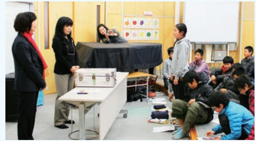
▲真剣に考える児童たち

1月19日、合志小学校で6年生を対象に租税教室が行なわれました。社団法人菊池法人会が、小学校の税の勉強に合わせ、毎年菊池地域の小学校で開催しているもので、同会の女性部会が講師となって、分かりやすく税の説明を行ないました。児童たちは税金が何に使われているかなどを発表し、また、「大人になってしっかり税金を払いたいです」となどの感想が聞かれました。