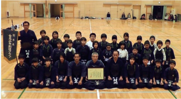
▲合志少年剣道クラブの皆さん