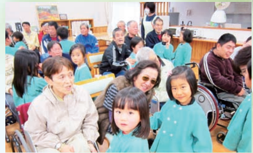
▲園児たちのかわいさに笑みがこぼれました

1月19日、栄保育園の園児37人が、身体障害者支援施設 白鳩園に慰問のため訪れました。