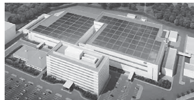
パネル設置イメージ(東京エレクトロン九州(株))

【東京エレクトロン九州(株)】 7月6日、セミコンテクノパークに立地する東京エレクトロン九州(株)で、同社工場屋根に設置するメガソーラー発電施設建設事業について、同社、市および県の三者間で事業推進に関する協定書を締結しました。 屋根面積約17,000㎡(約5,200坪)に約5億円を投じて約1,250キロワットの発電施設を整備する計画で、9月に着工し、12月の発電開始を目指しています。