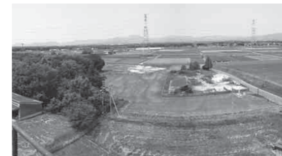
計画予定地(西部清掃工場跡地)