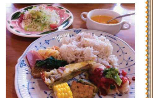
地元野菜を使った日替わりランチ (デザート・飲み物付) ¥800

開店して18年になりました。地元の野菜や食材をふんだんに使って、お菓子や料理を提供しています。ランチだけではなく、テイクアウトのお弁当、女子会やオリジナルディナーの予約ができますので、お問い合わせください。またレシピなどはすべて公開していますので、気軽にお尋ねください。