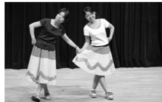
反射材ファッションショー