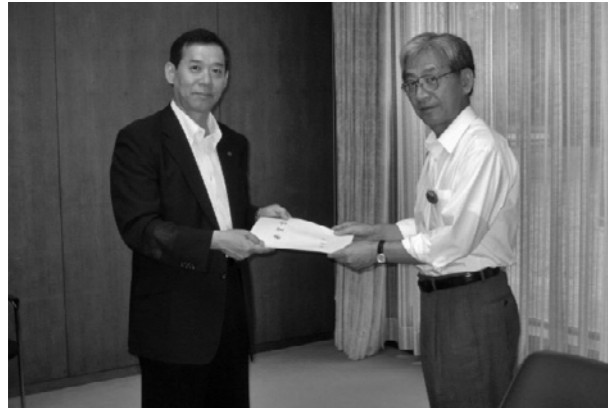
県議会 長野議会事務局長へ提出

8月9日、熊本県と熊本県議会、熊本県警察に対して、「合志市に警察署の新設を求める要望書」を提出しました。 この要望は、市内の各種団体でつくる「合志市に警察署設置を要望する会」が中心となつて継続的に要望活動を行なっていますが、これに合わせ、市においても「安全・安心なまちづくり」を推進するために「なつた」ものです。 住みよいまちを築くための大きな土台となる「警察署の設置」を求め、今後主要望活動が続いていきます。