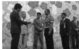
交通安全功労者表彰式

ステージイベントでは、競輪選手を招いての自転車クイズ王決定戦や、交通安全お笑いライブ、自転車シミュレーターを使った交通安全教室が行なわれ、交通安全に関する知識を深めました。 大会後には、交通安全運動出発式があり、パトカーと交通指導車が、交通安全運動の啓発に出發しました。