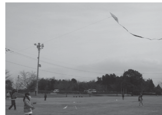
ヴィーブルふれあい緑地で高く飛ばそう