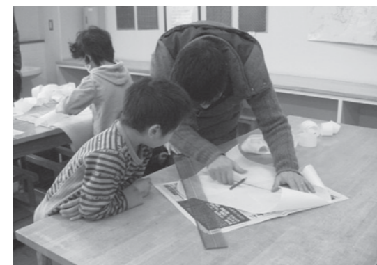
オリジナルのたこを作ります