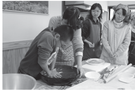
大学生が打ち方を指導しました

1月19日、上庄にある「みんなの家」で、そば打ち体験が行なわれました。上庄区と熊本県立大学の学生が共同で栽培したソバを使い、上庄区の子どもたちと県立大学生と一緒にそばを打ち、自分たちが作った打ち立てのそばを食べながらふれあいました。