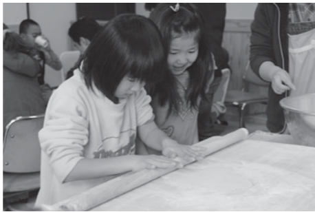
慎重に伸ばす、真剣な表情の子どもたち