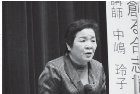
中嶋さんの笑いと熱気あふれる講演