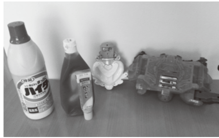
▲特に間違えやすいプラスチック製品

○汚れているものは洗ってください。(ケチャップや調味料が入っているプラスチック容器は、きれいに洗って資源物) ○プラスチックのおもちゃで、金属などの付属品が付いているものは不燃埋立ごみです。