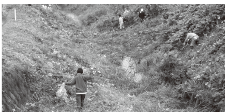
上生川での清掃活動

7月27日、市民や企業、市職員など約300人が「くまもと・きれいな川と海づくりデー」に伴う県下一斉清掃活動として塩浸川、上生川の清掃を行ないました。暑い中での作業となりましたが、軽トラック3台分のごみと雑草がなくなりきれいな川になりました。