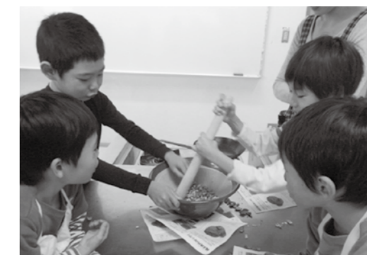
ドングリを粉にしています