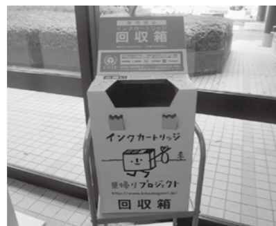
この回収箱が目印です

※業務用インクカートリッジ、トナーは対象外となりますので、回収箱の中には入れないでください。