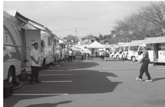
がん複合検診(泉ヶ丘市民センター)