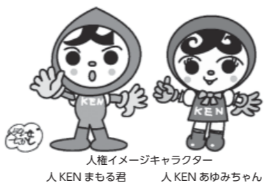
人権イメージキャラクター 人KENまもる君 人KENあゆみちゃん