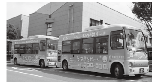
左回りのバス（オレンジ色）と右回りのバス（黄緑色）があります。

辻久保の電鉄バス営業所を起点・終点として、交通拠点や市の主要施設、大手スーパーなどを経由する環状路線バスです。2台のバスで運行しています。