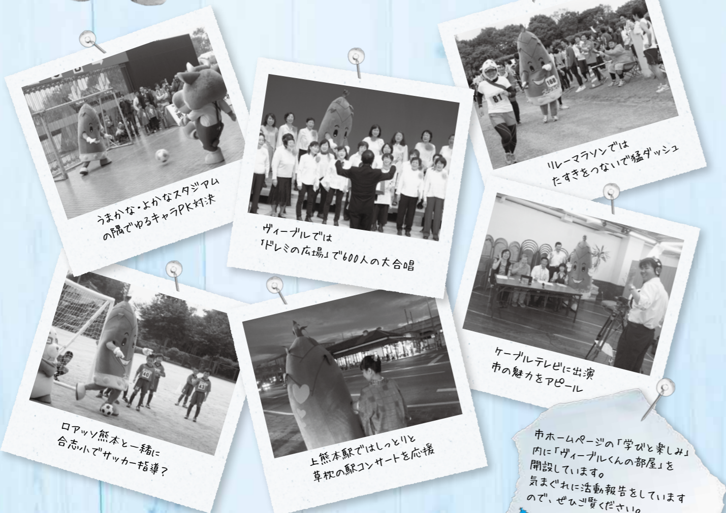
うまかな・よかなスタジアムの隅でゆるキャラPK対決