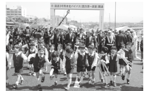
開通の様子はYoutube合志チャンネルで見ることができます

通り初めでは地域住民約1,200人が新しい道路を歩き、午後3時頃から一般車両の通行が始まりました。