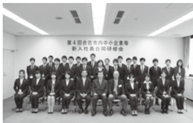
新社会人としての心得を学びました

研修には市内中小企業の新入社員や市役所の新規採用職員27人が参加し、地域経済の現状やビジネスマナーの基礎を学びました。受講者は「研修で学んだことを社会人生活に生かしていきたい」と、新社会人としての意気込みを新たにしました。