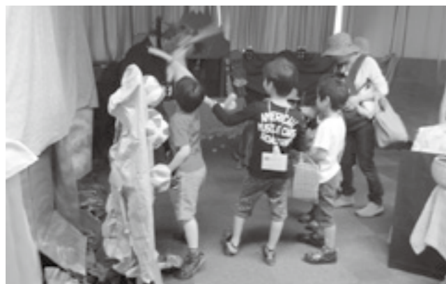
鬼ヶ島で鬼退治をする子どもたち

当日は、延べ800人が来場。子どもたちは、音楽や踊りを交えたおはなし会や、紙を使った工作体験などで本の世界を体験しました。わくわく桃太郎のコーナーでは、参加者が犬・猿・キジを仲間にして鬼退治に行くまでのプログラムを、クイズやゲームをしながら楽しみました。