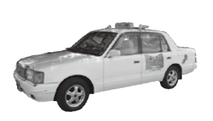
乗り合いタクシー

①後川辺線 ②合生・上生線 ①孔子公園～飯高山公園間、②再春荘病院～孔子公園間を運行。 火・木・土曜に①は1日2往復、②は1日往路1便・復路2便