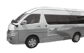
乗り合いタクシー

①須屋線 ②日向・新迫線 ①みずき台～再春荘病院、②日向地区～ユーパレス弁天間を往復。 火・木・土曜に1日2往復