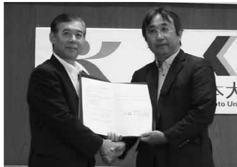
市長(左)と甲斐熊本大学薬学部長(右)

9月9日、熊本大学薬学部と市は互いに協力し、薬用植物の研究・開発の推進と地域経済の活性化に貢献することを目的として、連携・協力体制を構築するための連携協定を締結しました。今後は、熊本大学薬学部と連携しながら薬用植物の生産振興や利活用などに取り組み、新たな産業の振興と市民の健康づくりの向上を目指します。