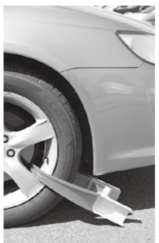
自動車差押 (タイヤロック)

財産調査により発見した財産（不動産・預貯金・給与・生命保険など）を差し押さえます。また、家宅搜索により動産や自動車を差し押さえます。