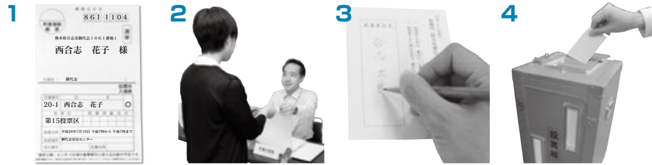
1 投票所入場券に書いてあ る投票所へ行く 2 受付で選挙人名簿と照合 し投票用紙を受け取る 3 記載台で候補者の氏名(ま たは政党名)を記入する 4 投票箱に入れば終了!

各種選挙制度について、詳しくは市ホームページでも紹 介しています。 ◀「選挙」コーナー QRコード