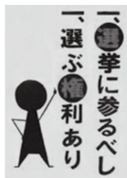
平成27年度 都道府県選挙管理委員会 連合会会長賞作品