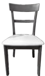
「譲ります」例 ダイニングテーブル用椅子