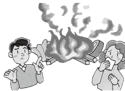
人体や環境に影響を与えます。ごみは決して燃やさないでください

ごみの焼却は法律や条例で禁止されています ごみの焼却は、煙で人に迷惑をかけるだけでなく環境にも害を与えるため、法律や条例で禁止されています。排出される二酸化炭素は地球温暖化を引き起こす原因になります。また、プラスチックやビニールなどの焼却で排出されるダイオキシンは大気汚染の原因となり、人体にも害を与える恐ろしい物質です。ごみは燃やすのではなく、正しく分別し、適切に処分しましょう。 ※ごみの焼却は「廃棄物の処理及び清掃に関する法律」により罰せられ、行為者は5年以下の懲役もしくは1千万円以下の罰金に処せられます。