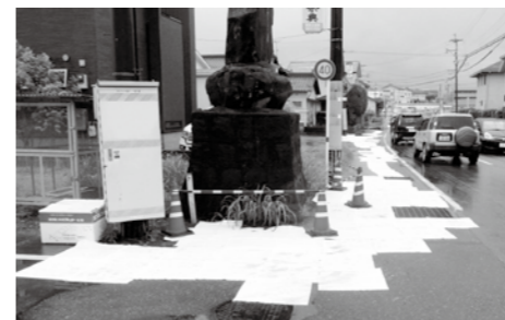
道路に敷き詰められた油吸着マット。流出した油の回収には多大な時間と費用を要します

油流出事故に注意 燃料タンクはよく点検を 寒さも厳しくなり、河川や海、道路や水路への油流出事故が増えています。ピニールハウスの暖房用の燃料タンクや施設・業務用機械、家庭用オイルタンクからの流出などが主な原因です。 油の流出は水質や土壌の汚染につながり、水生生物や河川環境、私たちの生活環境にも深刻な影響を与えます。また、事故を起こした場合、後処理費用は原因者の負担となります。 油を使うときは細心の注意を払い、流出事故防止に努めましょう。事故を起こした・発見した場合は速やかに環境衛生課へ連絡してください。