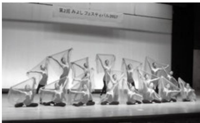
華麗な体操を披露したR I N新体操クラブの皆さん

1月8日、御代志市民センターで第2回みよしフェスティバルを開催しました。これは御代志周辺の地区で構成する中央コミュニティが企画したイベントです。「みんなで楽しく、明るく、元気よく合志を盛り上げよう！」を合言葉に、21団体がブレイクダンスや吹奏楽、新体操など日頃の練習の成果を披露。音楽に合わせて約500人の観客が手拍子をする、会場は大きく盛り上がり、熱気と歓声に包まれました。