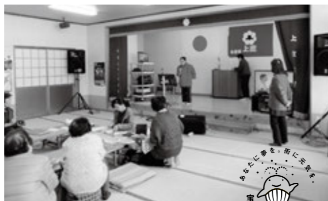
公民館でカラオケ交流を楽しむ上庄の皆さん

1月11日、上庄公民館に、マイクやスピーカーなど、コミュニティ活動に使用する備品が整備されました。これは地域コミュニティの健全な発展を目的として実施される、コミュニティ助成事業を活用した取り組みです。宝くじ社会貢献広報事業費を財源として、一般財団法人自治総合センターが費用を助成。上庄区で整備された音響設備は、公民館での行事やカラオケ交流など、区の地域活動の活性化に活用されています。