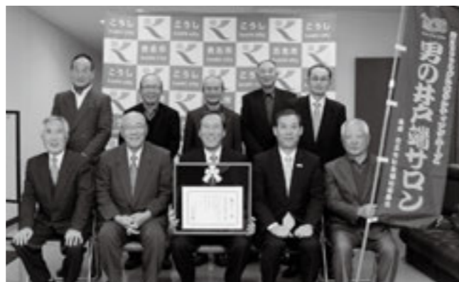
男の井戸端サロンの皆さん。児童の下校見守りなども行なっています

1月7日、熊本日日新聞社から男の井戸端サロンへ、長年にわたって社会奉仕や環境美化活動に取り組む人をたたえる第114回緑のリボン賞が贈られました。男の井戸端サロンは、男性有志15人による結成10年目のボランティア団体です。ふれあい館隣の農園で野菜を作り、このみ坂保育園の園児や保護者、地域の高齢者との収穫体験を通じて幅広い世代と交流。「楽しみながら」をモットーに地域交流活動をしています。