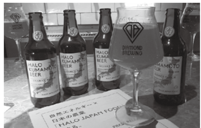
ビールに合う野菜チップスも開発中です

3月28日、一般社団法人合志農業活力基金(磯野謙代表)が「HALO JAPAN FOOD」の新作商品発表会を行いました。同基金は、自然電力株式会社・熊本製粉株式会社・市の3者で運営し、市の農業の振興に取り組んでいます。甘草を使ったりコリスピールと市の農産物を使った野菜チップスを発表。ビールは熊本市にあるBrewery KAEN(熊本市東区長嶺南3-1-102)で飲むことができます。