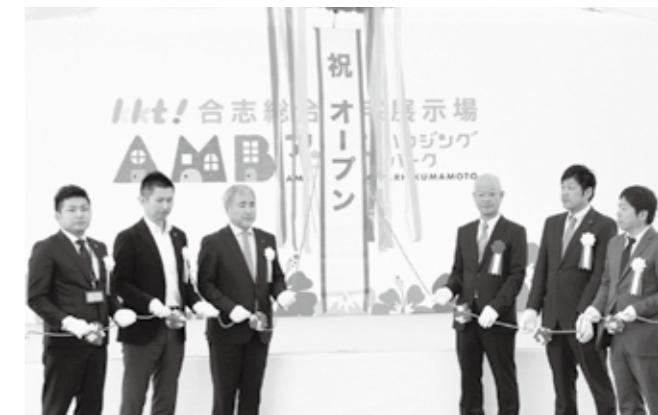
オープンを祝う関係者の皆さん

3月31日、アンビー熊本(竹迫)内のKKT合志総合住宅展示場で、同展示場のオープニング式典が開催されました。当日は市内外から多くの人が訪れ、熱心に展示場を見学。式典では、副市長や関係者などがくす玉割りを行ない、展示場のオープンを祝いました。今後、市民の皆さんが快適な生活を送れるよう、食料品からDIY用品まで揃った大型スーパーや、物産館、温浴施設などの建設が予定されています。