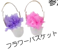
フラワーバスケット