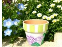
★写真はイメージです★

日時 : 6月21日(日) 午後1時30分～午後3時30分 場所 : 東児童館 図書室 対象 : 小学生10人(先着) 申込み : 5月30日(土)午前9時～ 6月13日(土)午後4時 内容 : 先生にならって茶色い素焼きの 植木鉢に絵をかきます。 参加費 : 300円(当日あつめます)