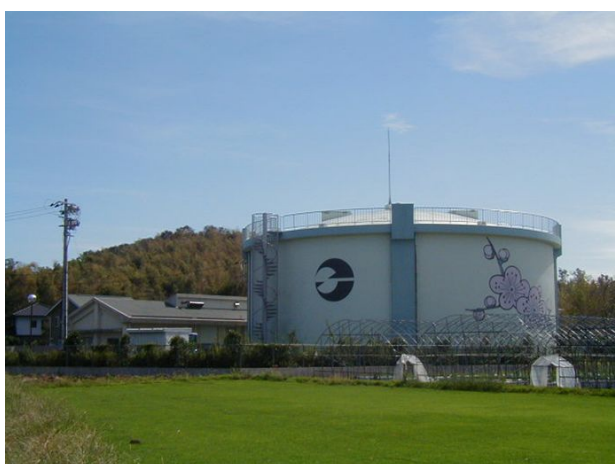
(水道事業：群配水池)