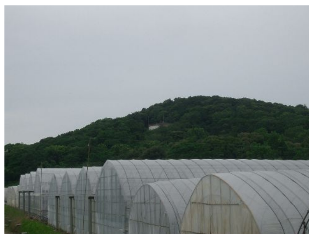
(水道事業：弁天配水池)