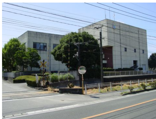
(下水道事業：須屋浄化センター)