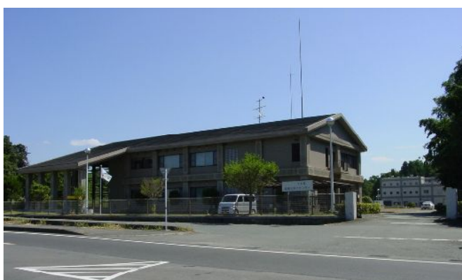
(下水道事業：塩浸川浄化センター)