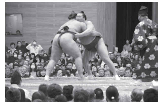
息をのむ取組に会場は大盛り上がり

観客は普段テレビの前で見る力士の大きさを間近で感じ、目の前で繰り広げられる取組の迫力に圧倒されました。握手会など力士とのふれあいも楽しんだ他、本場所では見られない初切や相撲甚句などの見世物では、笑い声や歓声が響いていました。