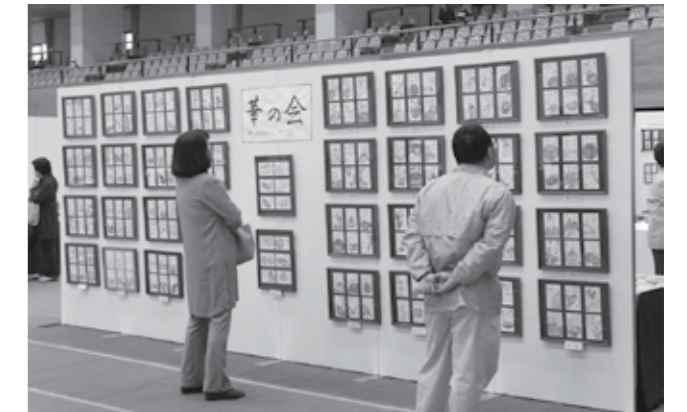
訪れた人は熱心に作品を鑑賞しました

ステージ部門では子どもたちをはじめ出演者の歌や踊りなどの演技に、温かい拍手が鳴りやまず響きました。展示部門では多彩な作品が並び、鑑賞した人は「作品のレベルが毎年向上していて素晴らしいです」と感激していました。