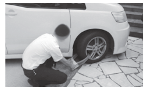
◀ 自動車の差し押さえ