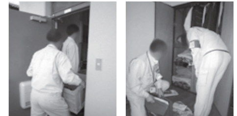
◀ 家宅捜索による差し押さえ