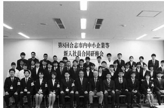
これから新社会人として頑張ります

市内中小企業の新入社員や市役所の新規採用職員、合わせて56人が地域経済の現状やビジネスマナーを学びました。受講した人からは「社会に関心を持つことの重要性を学んだ。仕事をするとときに生かしていきたい」といった声がありました。