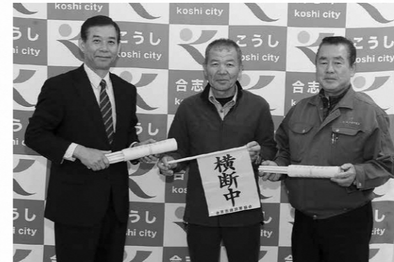
左から市長、塚本会長、水上事務局長

毎年この時期になると「子どもたちの登下校時に活用してほしい」と同協会から横断旗が寄贈されます。寄贈された横断旗は、市内の交差点や信号機のない横断歩道などに設置され、子どもたちの安全な登下校を支えています。