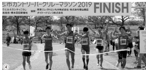
①一斉にスタート ②緑の中を駆けるランナー ③しっかりとタスキをつなぎます ④ゴールはチーム全員で