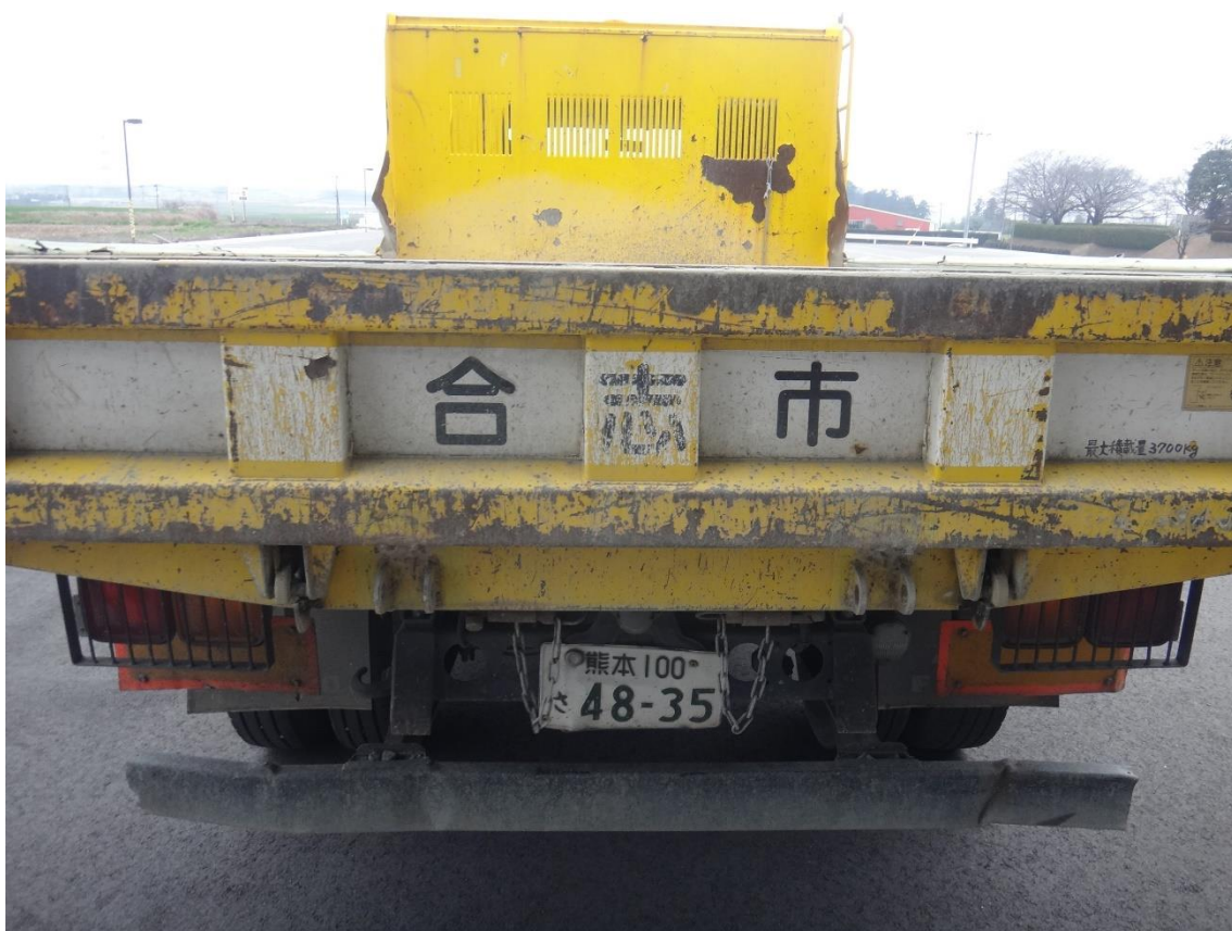
大きな損傷箇所⑤-1（右側ガードフレームの変形）